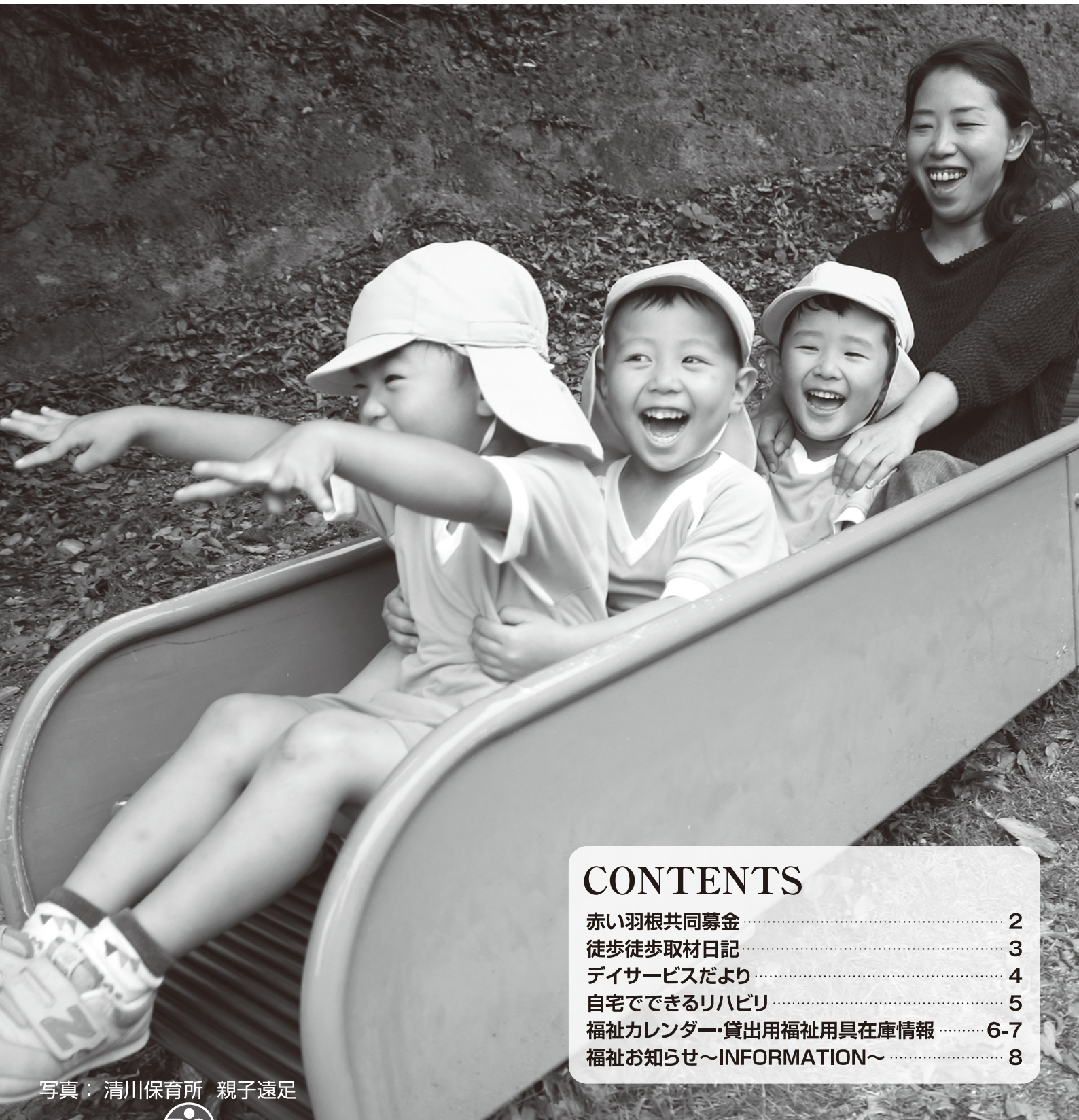
写真：清川保育所 親子遠足