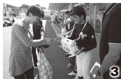
◆1東岩代八幡神社秋祭り◆2・3南部小学校ボランティアのみんな(オークワ前)

10月初旬から末にかけて、赤い羽根共同募金運動の一環として、各地域の秋祭りにて街頭募金運動を実施しました。