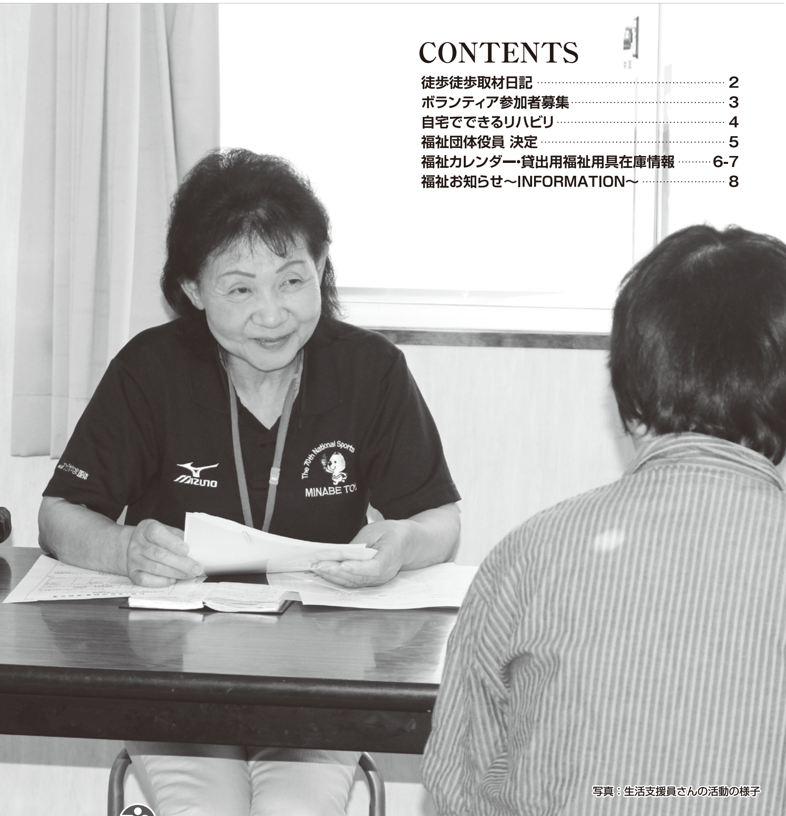
写真：生活支援員さんの活動の様子