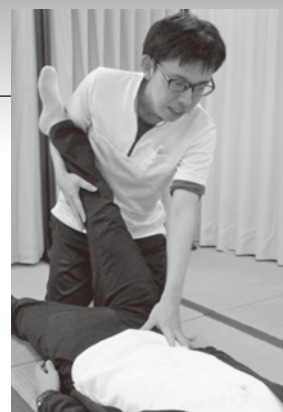
趣味 野球・旅行・日曜大工 健康の秘訣 筋トレ

これからも、このような新鮮な気持ちを忘れず、みなべ町の方々に色々ご教授いただきながらリハビリテーションを通じて皆様の健康に少しでも貢献できるよう精進して参ります。どうぞよろしくお願い申し上げます。