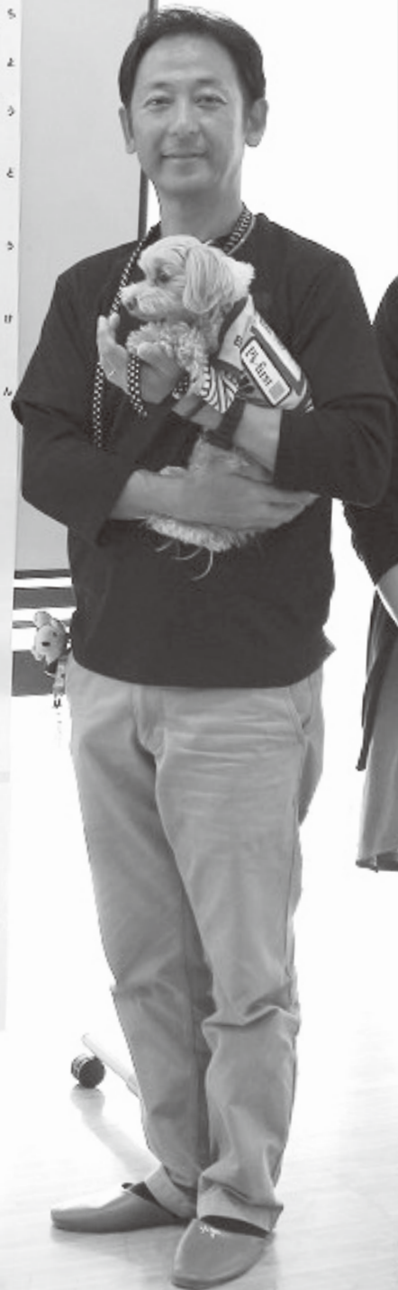
写真：上南部小学校 福祉教育