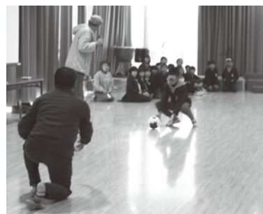
アイマスクを装着し体験