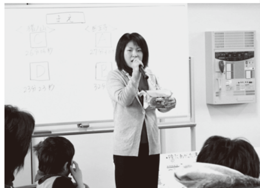
(写真：親子防災教室)