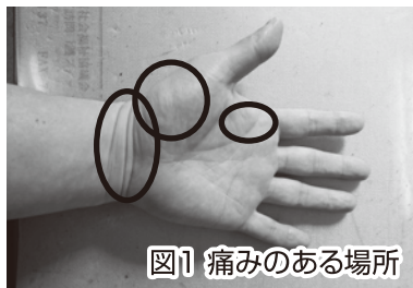
図1 痛みのある場所

今回も引き続き「腱鞘炎を予防する又は悪化を防ぐストレッチ」を痛みの場所を変えて紹介させていただきたいと思います。「腱鞘炎を予防する又は悪化を防ぐストレッチ」は3月号で紹介させていただいた重症度の1・2のときに行うようにしましょう。