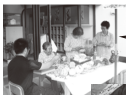
梅干しまラカス作り