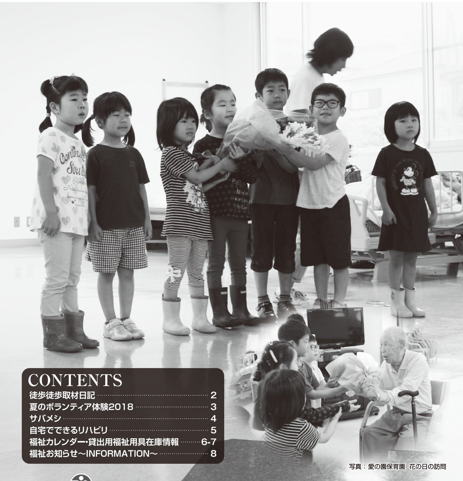
写真：愛の園保育園 花の日の訪問