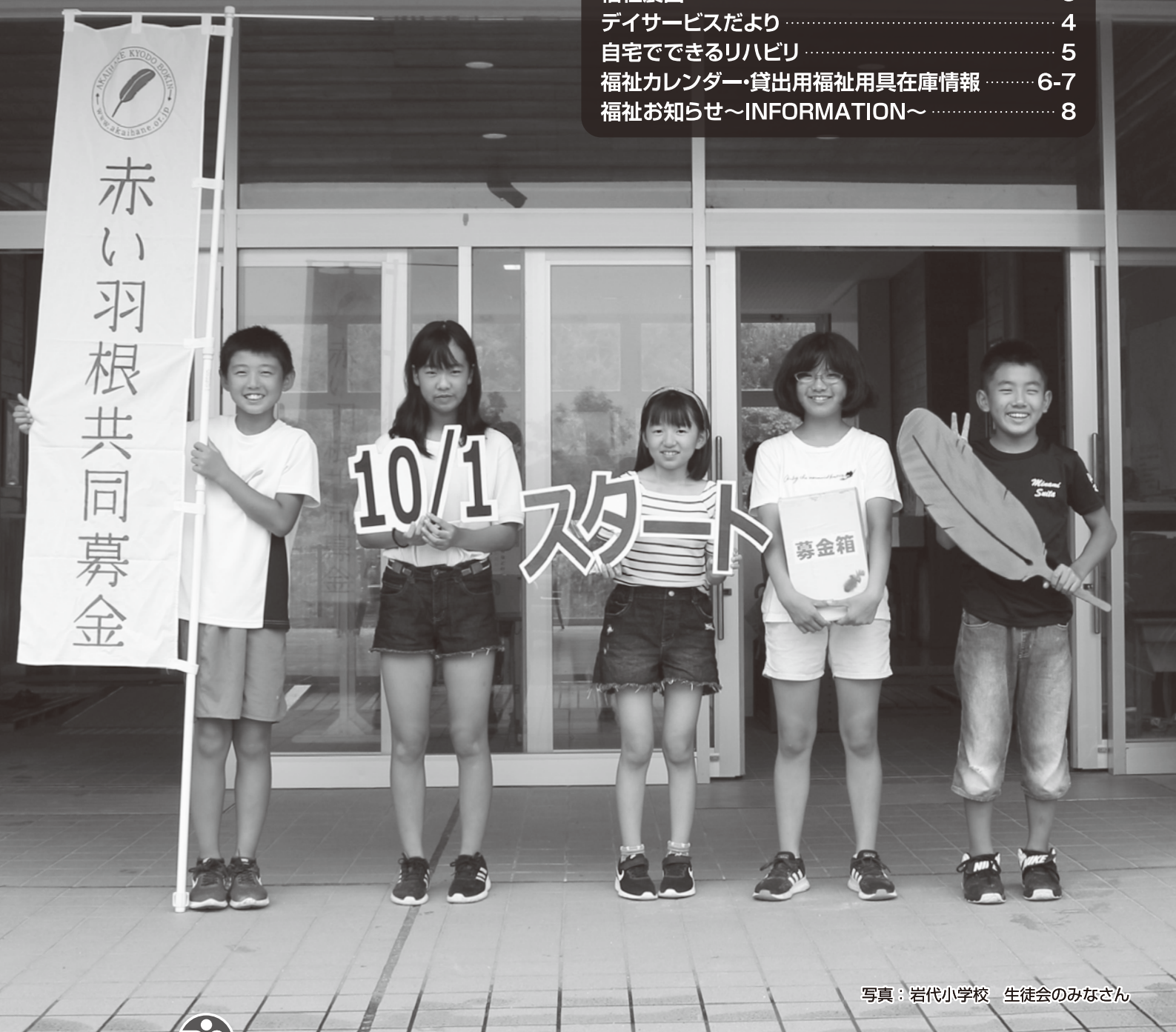
写真：岩代小学校 生徒会のみなさん