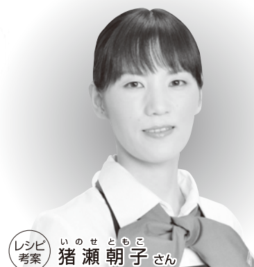
レシピ 考案 いのせともこ 猪瀬朝子さん