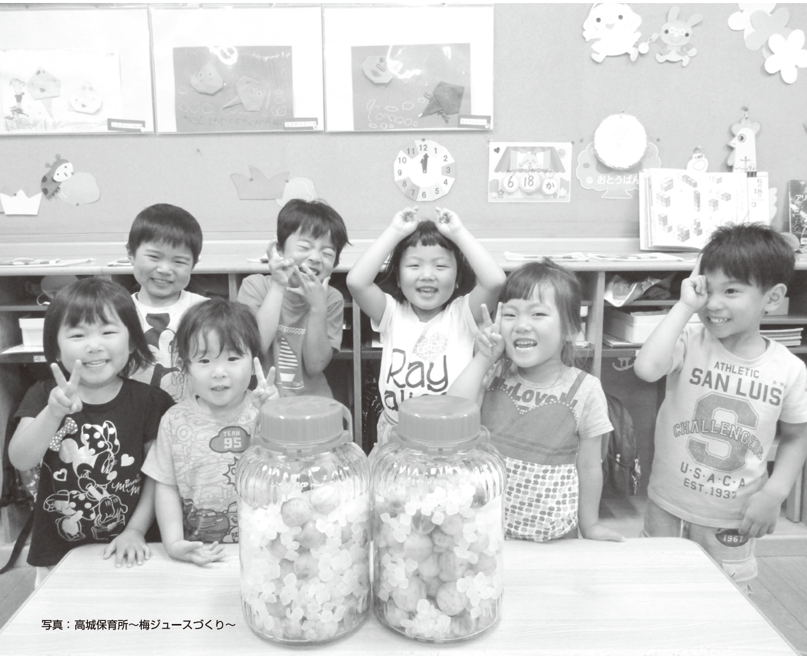
写真：高城保育所～梅ジュースづくり～