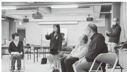
最終日には、手話で自己紹介ができるようになりました