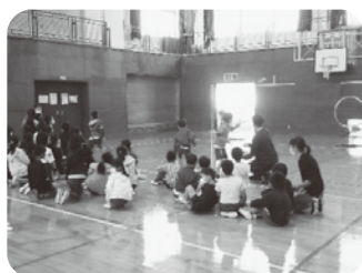
フライングディスク