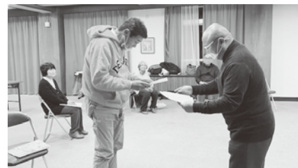
最後に修了証書をお渡ししました