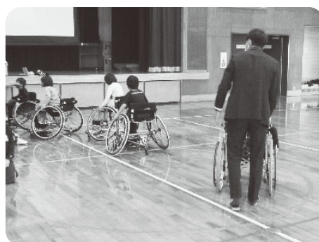
車いすバスケット用の車いす体験をしています