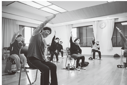
1,2,3 と皆で声を出してストレッチ

去年から始め、参加者はだいたい 12,3 人です。毎週和気あいあいとみんなで体操をしています。 みんなと顔を合わせて、元気が確認し合っています。毎週ここに来ることに意義があると思っています。