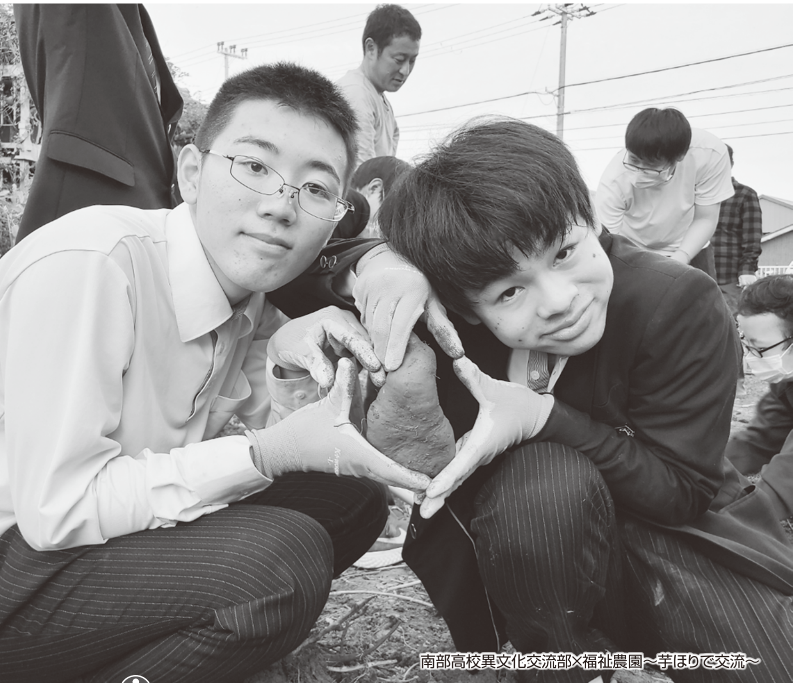
南部高校異文化交流部×福祉農園～芋ほりで交流～