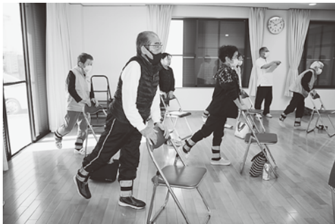
足の筋肉を鍛える筋力運動