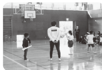
ジャベリックスロー