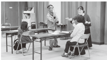
手話の基本である指文字の練習