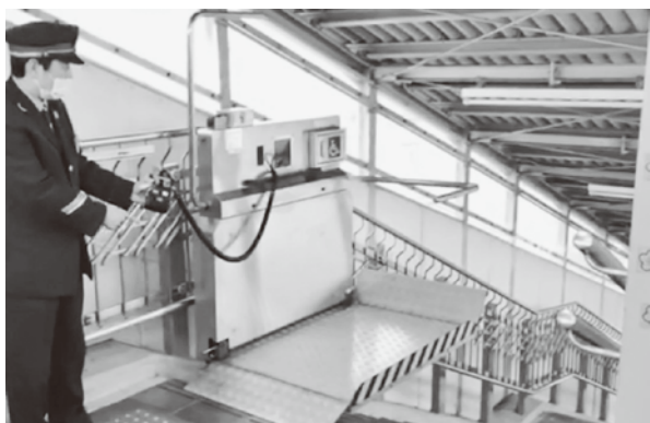
車椅子昇降機（エスカル）

車いす用の階段昇降機です。エレベーターの無い駅に設置されており、南部駅にもあります。