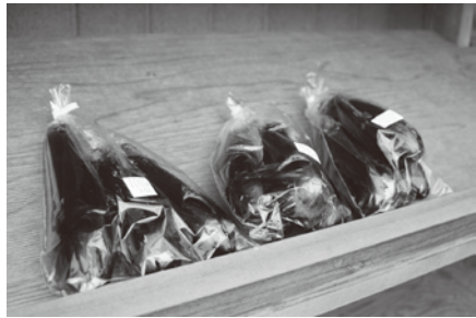
店の前では、野菜の販売も！新鮮とれたて地元の野菜です！

清川の地域の方が日替わりママとなり喫茶店を盛り上げてくれています。また、ママを手伝ってくれる方もいますし、この建物自体は、清川の方が無償で提供してくれており、地域のみなの力があって、この場所は成り立っています。