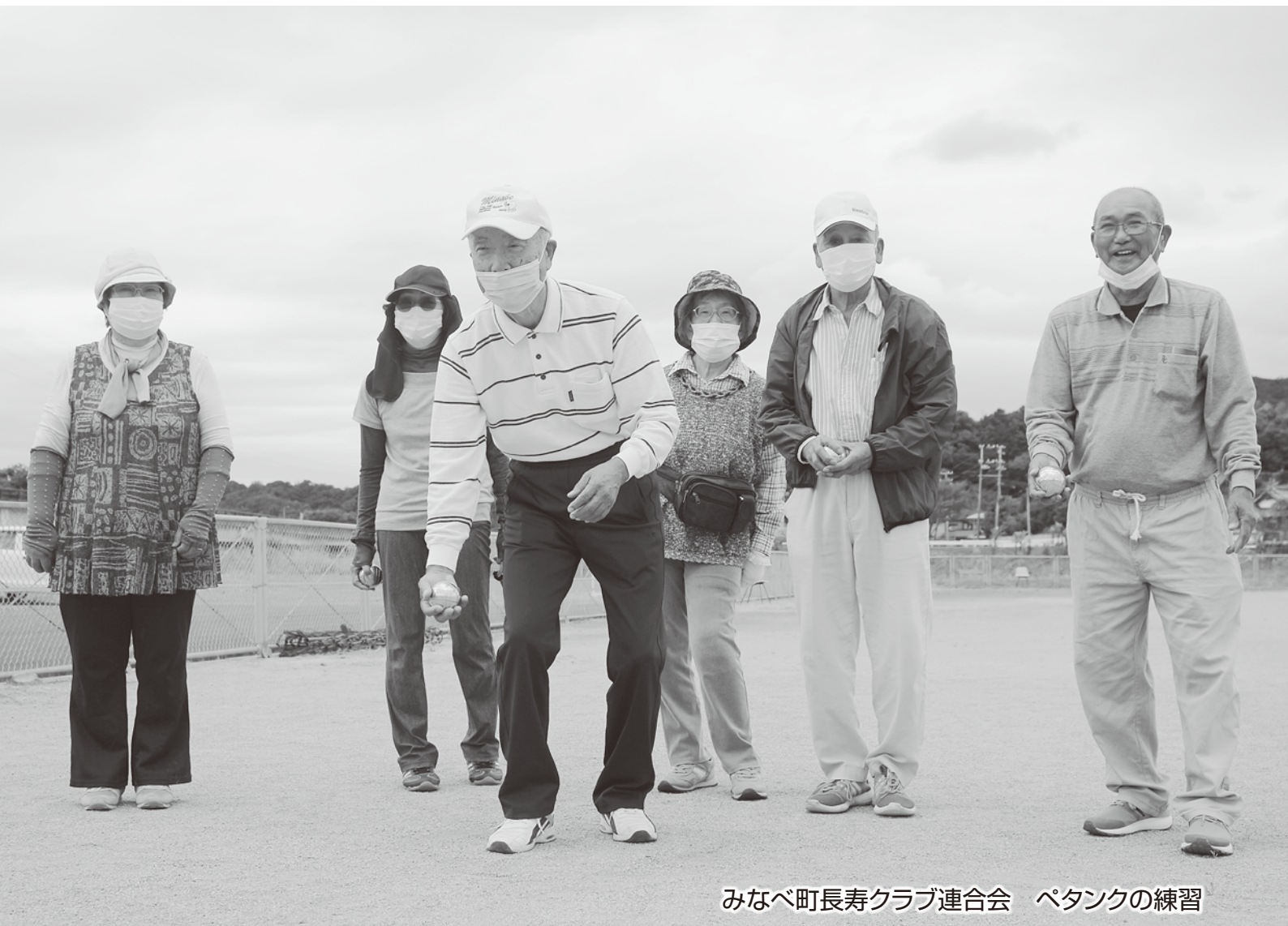
みなべ町長寿クラブ連合会 ペタンクの練習