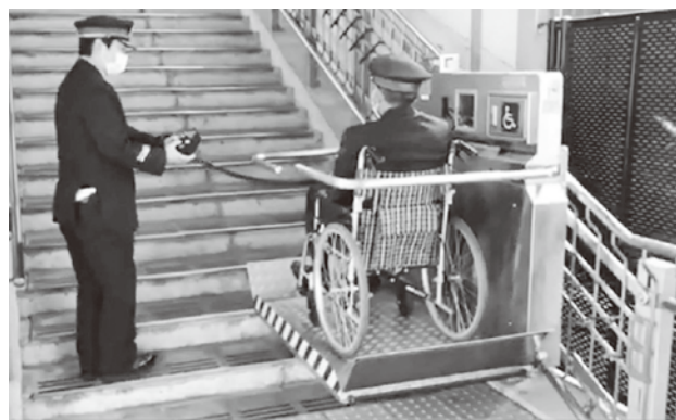
実際に使っている様子