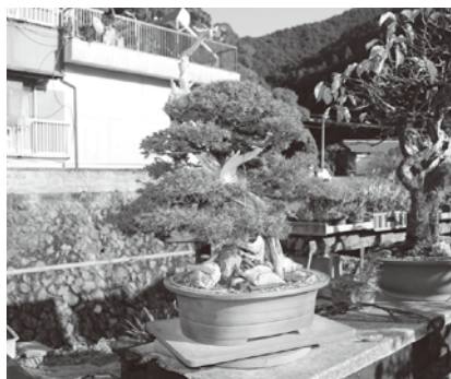
大きくなった盆栽は 3~5年に1度植え替えます