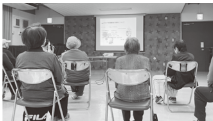
①みなべ町の現状について包括支援センターさんよりお話

10月25日（月）に南部公民館でみなべ町地域包括支援センターと一緒に百歳体操の体験会を行いました。今回は、片町和交クラブ（長寿クラブ）のご協力を頂き開催しました。