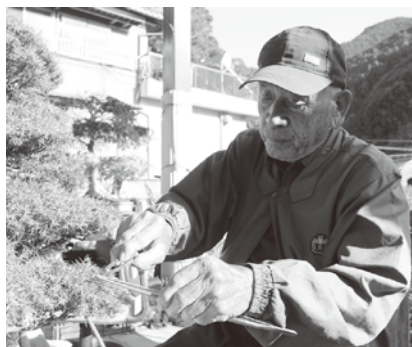
盆栽の葉を抜く作業 1つの盆栽を手入れするのに 1日かかります

毎日水やりをしないといけないし、手入れをしてやらないといけないので、寝込んではいられません。コロナで皆に見てもらえる機会が減り寂しいので、色んな人に見に来てもらえたら嬉しいです。