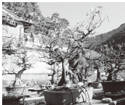
「盆梅」は2月にきれいな 梅の花を咲かせます