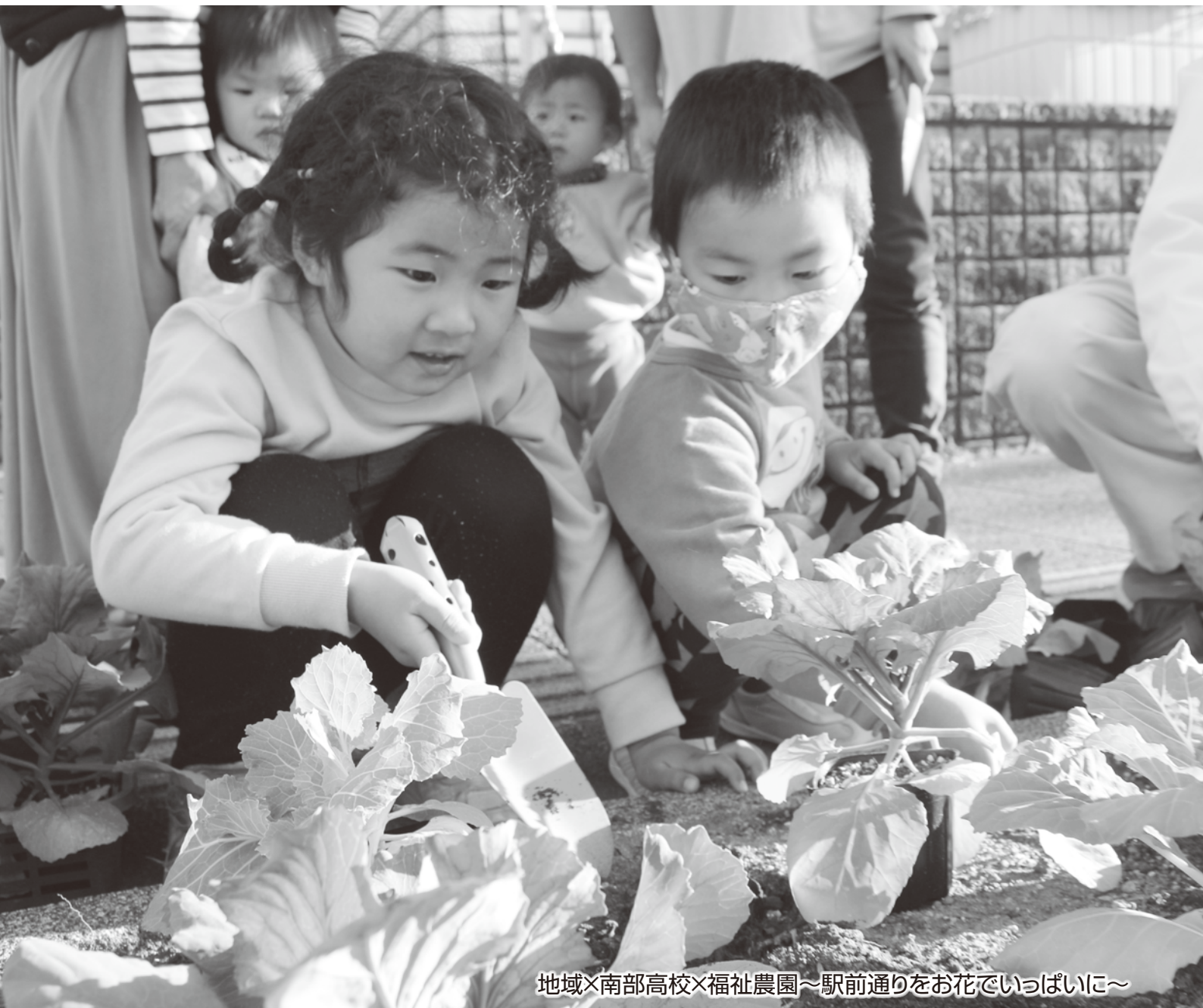
地域×南部高校×福祉農園～駅前通りをお花でいっぱい～