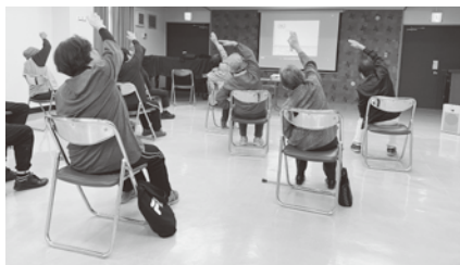
②百歳体操をみんなで体験