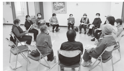
③円になってこれからの事をみんなで意見交換