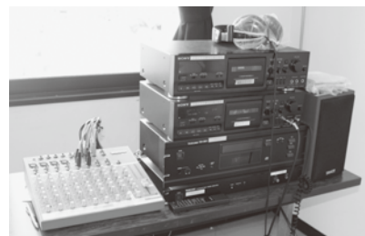
この機械で録音しています

視覚障がい者や文字が読みにくい高齢者の方などを対象に広報みなべ・福祉みなべを毎月「声の広報」としてCDに録音し、無料でお届けしています。ご要望の方は、社協までご連絡ください。※希望によりテープにも録音し、お渡すことができます。