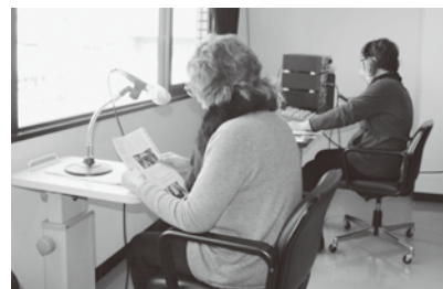
録音している様子

視覚障がい者さんだけでなく、高齢により目が悪くなり読みにくくなった方や、身体的障がい・制限などで本を手元に読むという行動ができない、できにくい方など、たくさんの方たちに聞いてもらうことが目標です。はあとグループのメンバーの年齢も高齢化してきているのが現状ですが、新しいメンバーも入ってくれたらいいなと思っています。