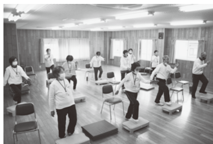
歌を唄いながらステップ台の上り下り