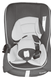
Combi ミニマグランデS 新生児～4歳頃まで対応