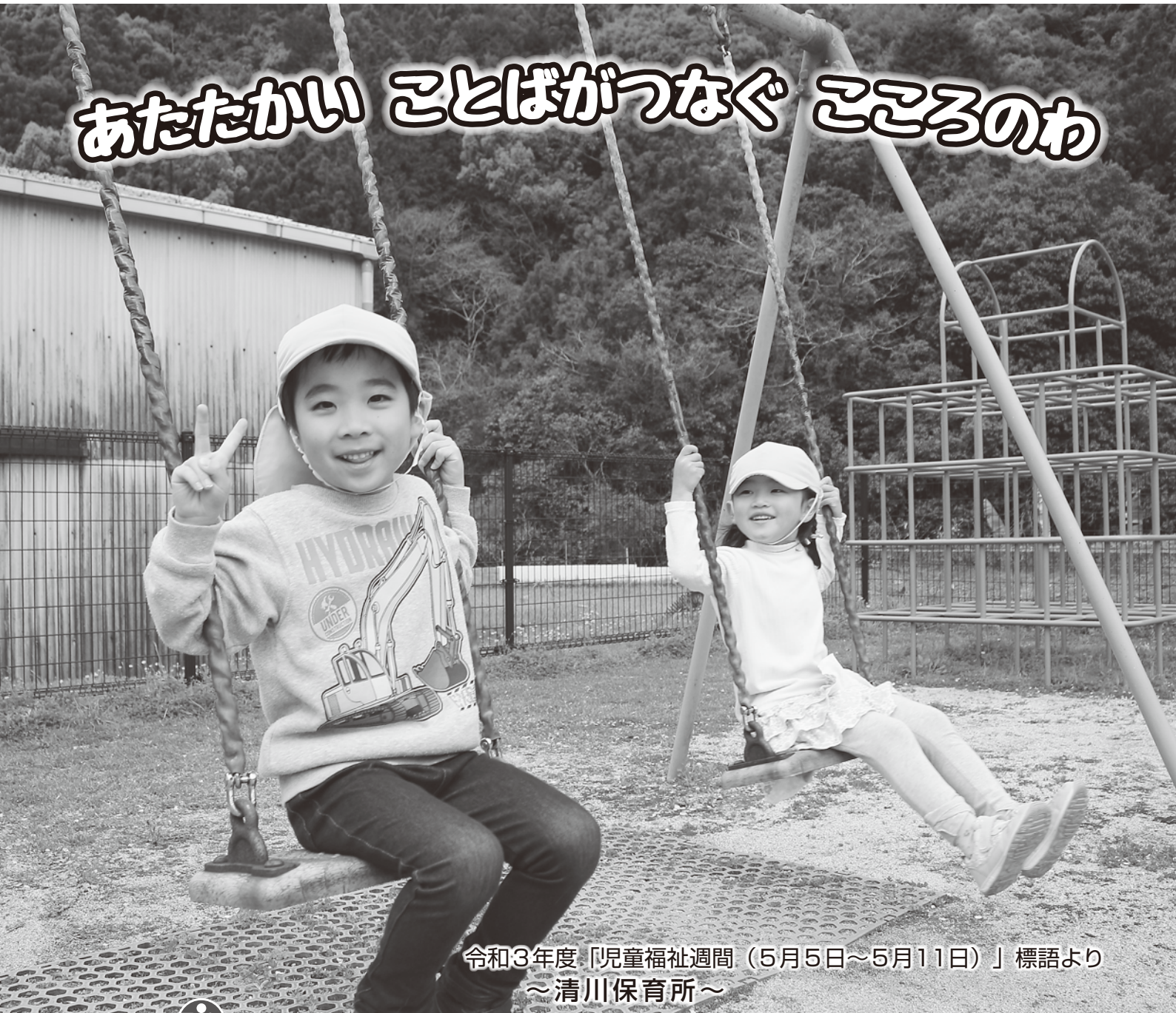
令和3年度「児童福祉週間（5月5日～5月11日）」標語より ～清川保育所～