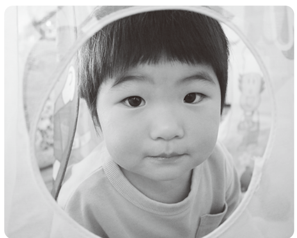
お母さんからひと言:いつも優しいお兄ちゃん! これからも弟と仲良く元気に遊んでね!!