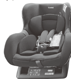
Combi ウィゴシリーズ 18kg以下の乳幼児対応