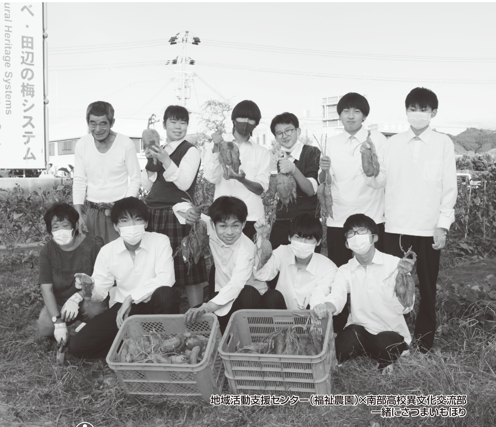
地域活動支援センター(福祉農園)×南部高校異文化交流部 一緒にさつまいもほり