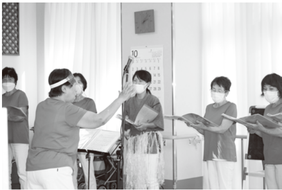
プラムコーラスさんによる合唱の様子

10月11日のおれんじの日では、「夏の思い出」をテーマにプラムコーラスさんによる合唱を楽しみました。