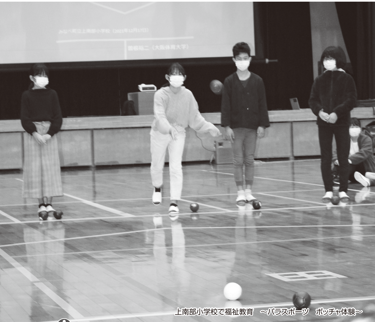
上南部小学校で福祉教育 ~パラスポーツ ボッチャ体験~