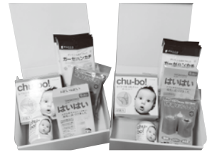
乳児用防災セット