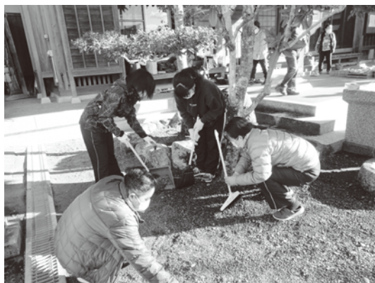
高校生ボランティアを募集し一緒に清掃活動 独自にボランティア活動証明書を発行

親子同士の交流、また、地域交流、清掃活動などを行っています。一昨年は、柏餅づくり、昨年は、レジ袋の廃止に伴いみんなでかわいい生地を買ってエコバックを作成し親子で交流を深めたそうです。たそうです。