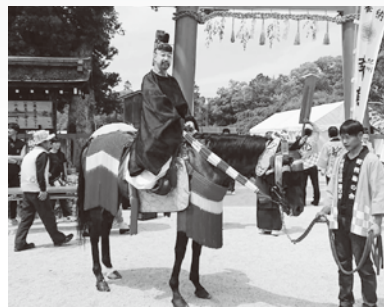
(そのほか、日本人形や馬の衣装も製作しています)