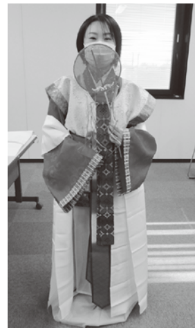
(飛鳥時代～平安時代初期を参考に作成したPR衣装)