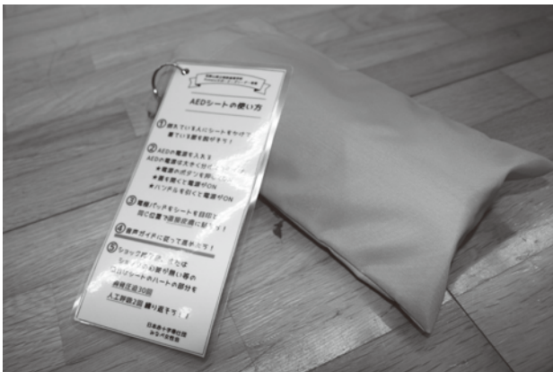
シートと使い方説明書のセット

シートにはわかりやすいように、心臓の位置に ハートマーク 、PADを貼る位置に 四角マーク を貼り付けています。