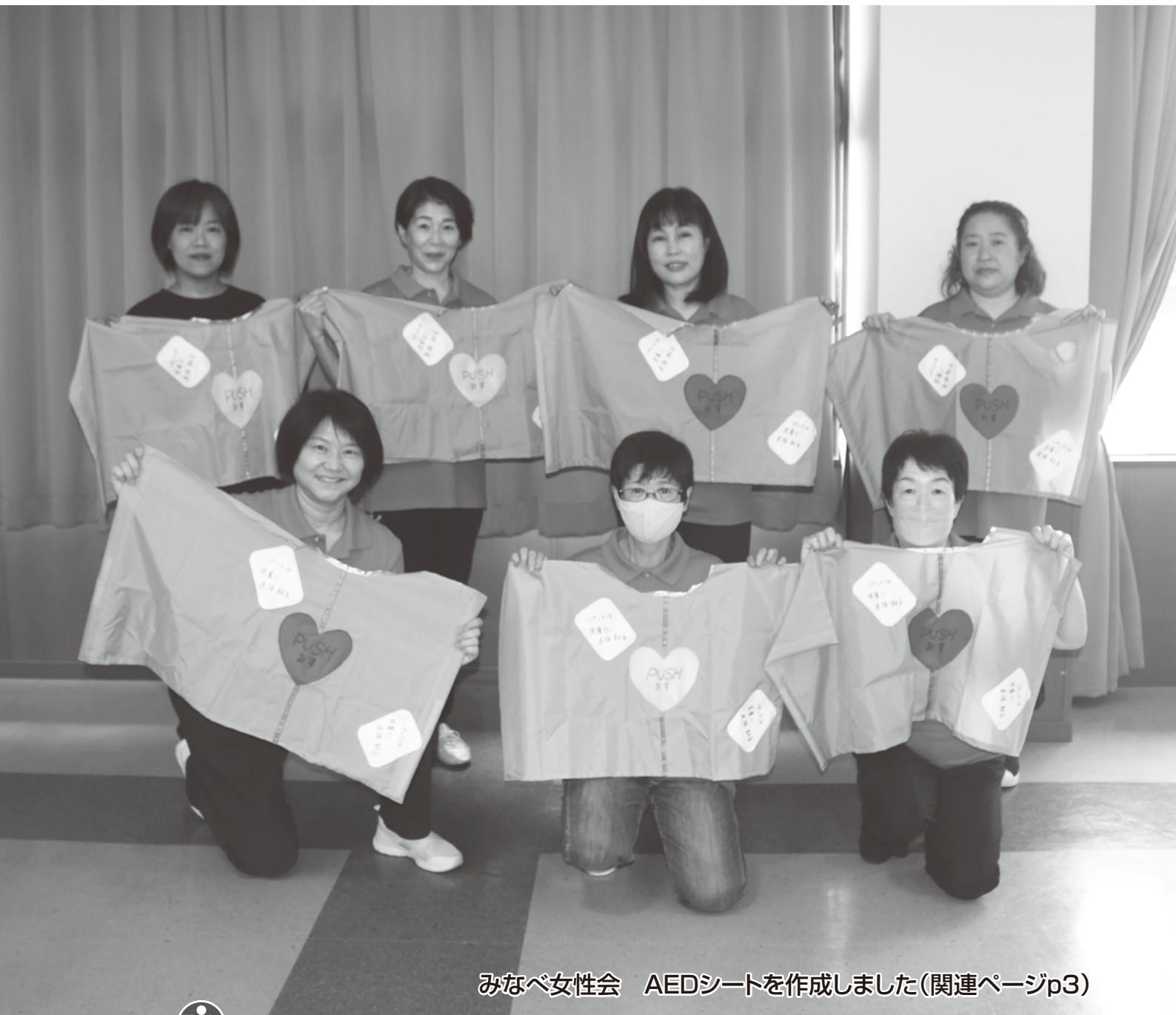
みなべ女性会 AEDシートを作成しました(関連ページp3)