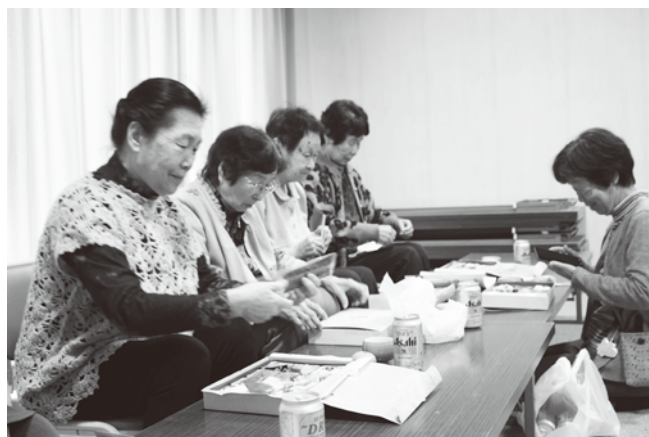
お弁当を食べながら親睦会