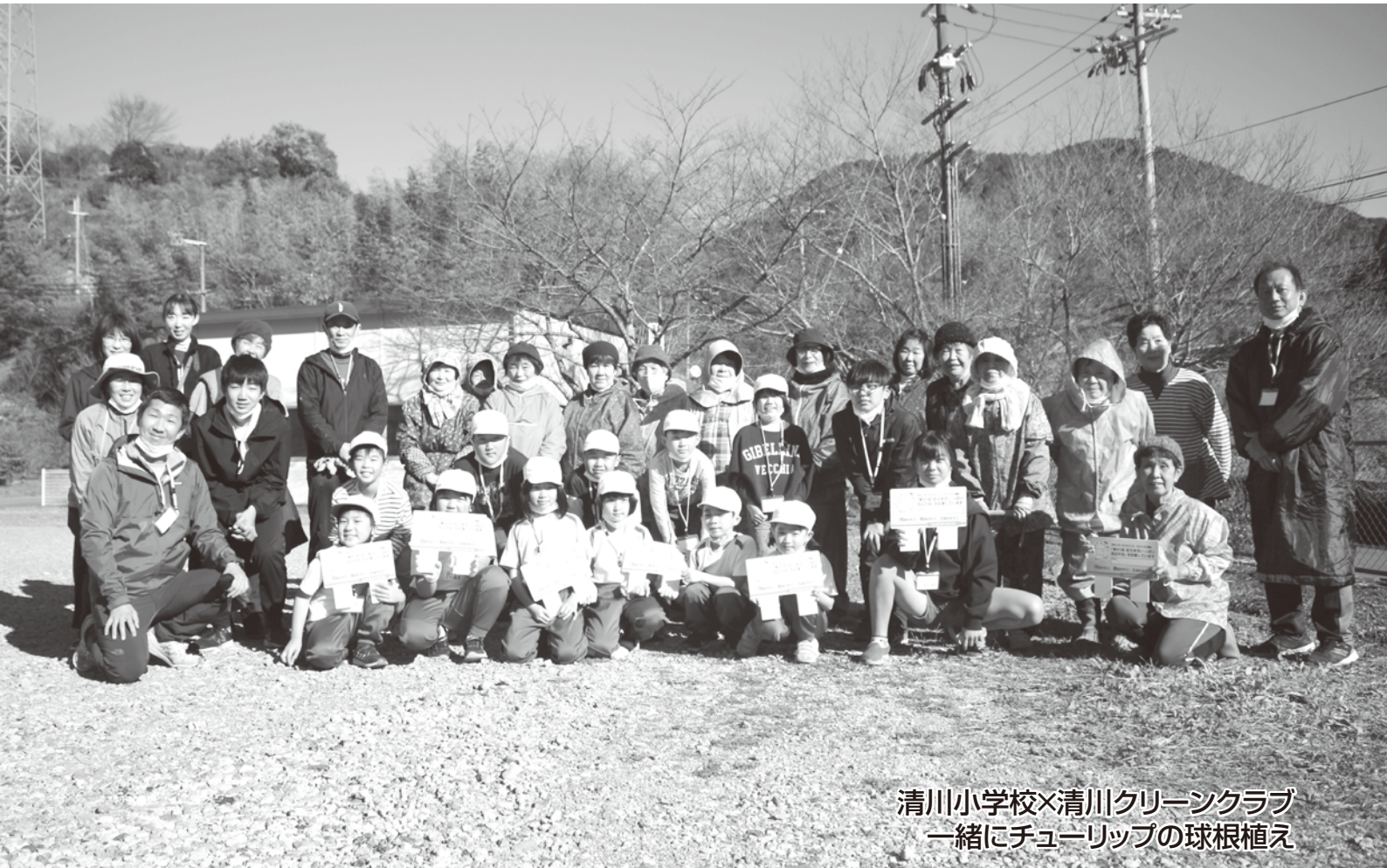
清川小学校×清川クリーンクラブ 一緒にチューリップの球根植え