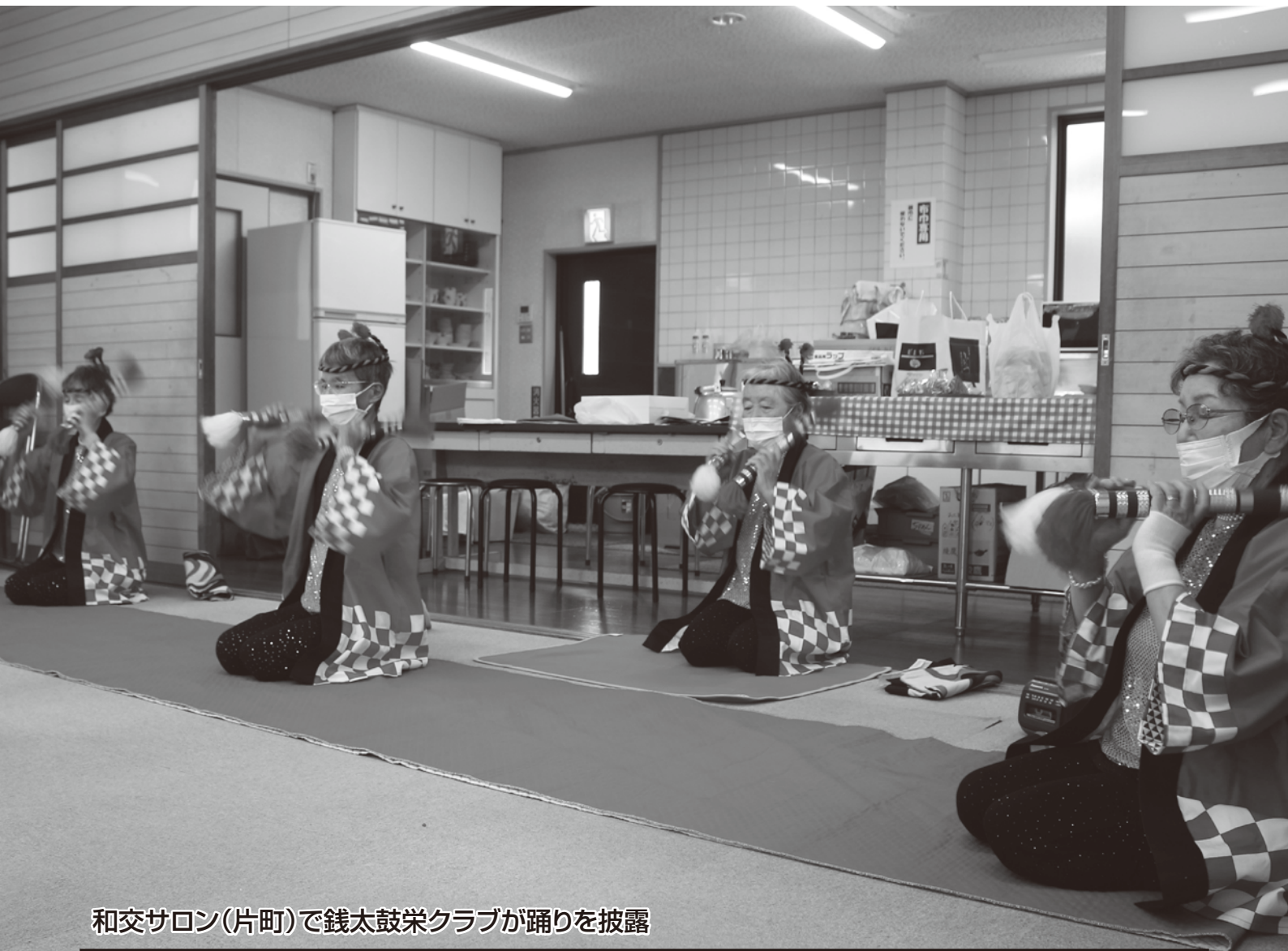
和交サロン(片町)で銭太鼓栄クラブが踊りを披露