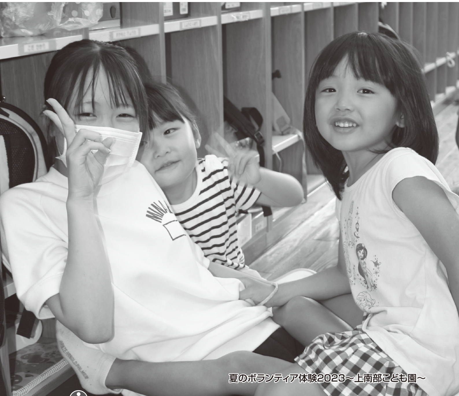
夏のボランティア体験2023～上南部こども園～