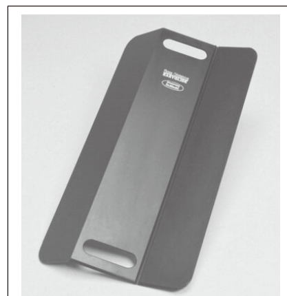
スライディングボード

スライディングボードの上はすべりやすくなっており、車いすとベッド間を座ったまま移動させることで、介助者と介助される者の負担を軽減するための道具です。