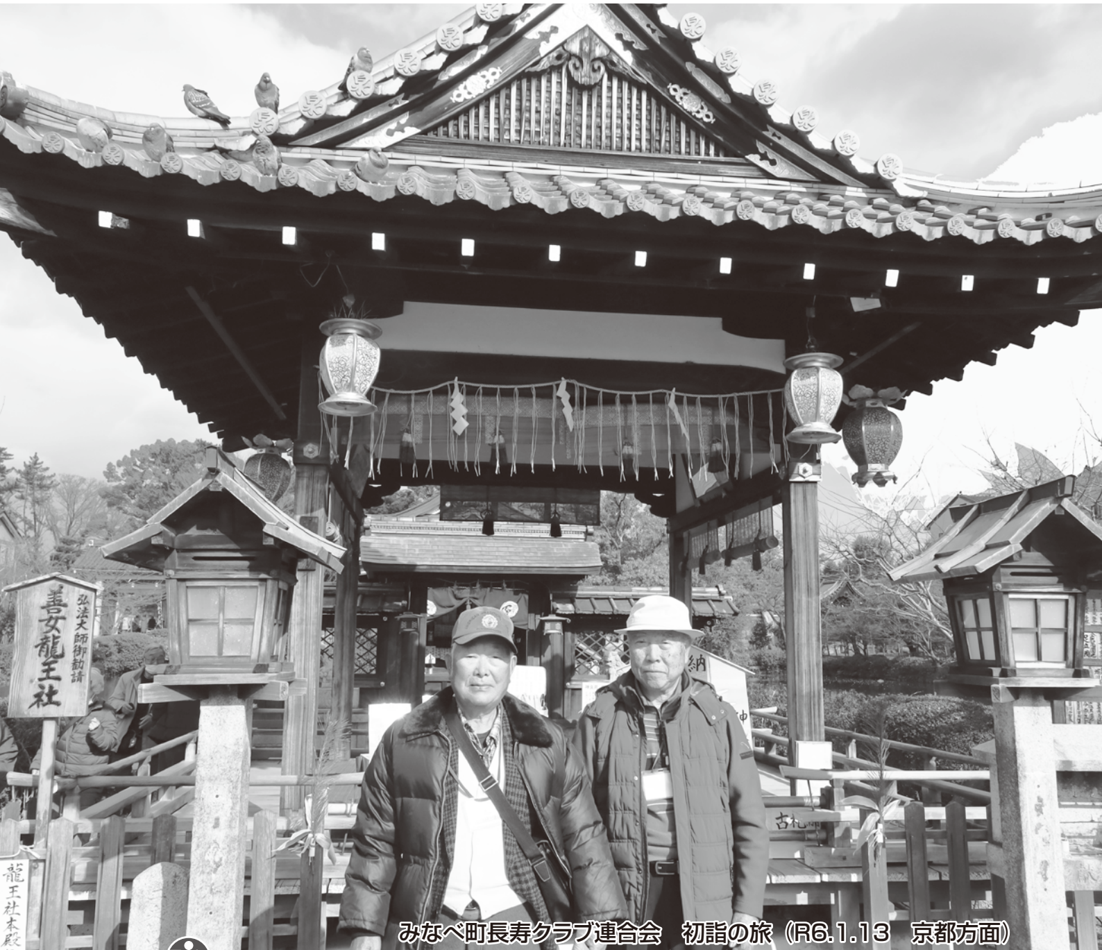
みなべ町長寿クラブ連合会 初詣の旅 (R6.1.13 京都方面)