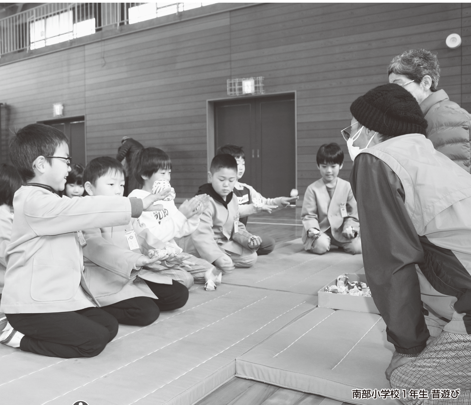
南部小学校1年生 昔遊び