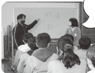
あるく大野さんの話

これから生徒さんが社会へ出たときにいろんな方に寄り添っていただけるサポーターであってほしいなと思います。