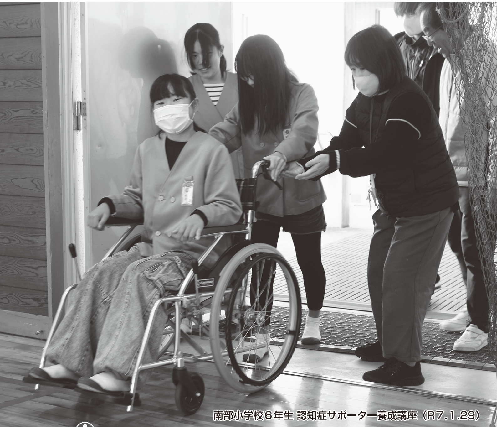
南部小学校6年生 認知症サポーター養成講座 (R7.1.29)