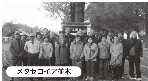
メタセコイア並木

比叡山延暦寺の紅葉は見ごろを迎えており、色とりどりの紅葉に「わ～もみじのトンネルやなあ～！」と感激の声があがり、みなさんの思い出に残ったのではないかと思います。