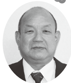
みなべ町社会福祉協議会

さらに、和歌山県社会福祉協議会主催の「広域災害ボランティアセンター立ち上げ訓練」を担当しみなべ町並びに町内の奉仕団体の皆様と共に災害対応への準備として取り組む予定です。